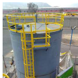
Ingeniería, fabricación y montaje de 2 tanques de 300 m 3