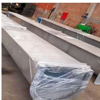
Fabricación y montaje de transportadores helicoidales en zona seca.