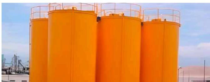
Estructura soporte con 6 tanques decantadores de aceite de 120 m 3 c/u.