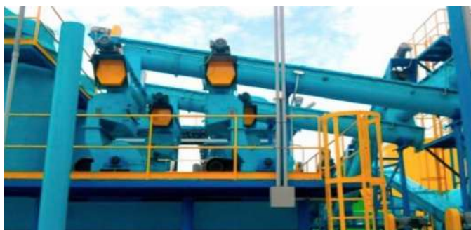
Fabricación, montaje de transportadores helicoidales en zona seca y húmeda. Fabricación locales montajes mecánicos.