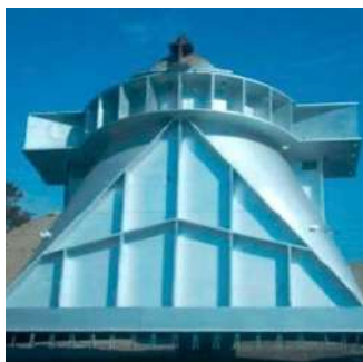
Fabricación cuerpo Bull Nose - Horno fundición.