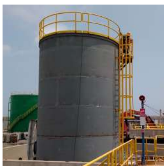
Fabricación y montaje de tanque de 250 m 3