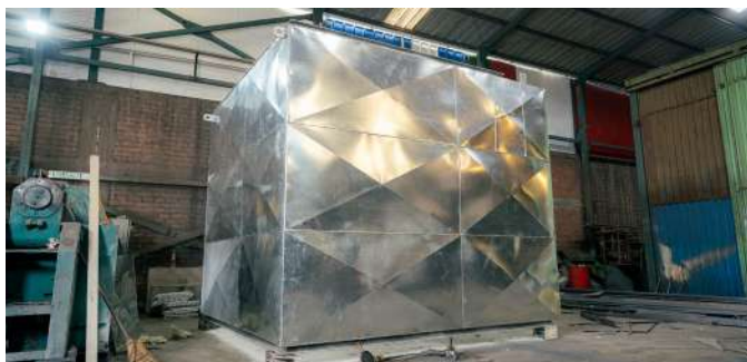
Fabricación de cajones- Bag House Fundición.