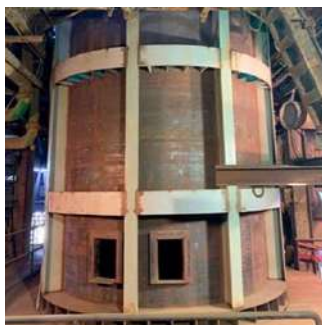
Fabricación y montaje de cilindro en acero naval A-131.