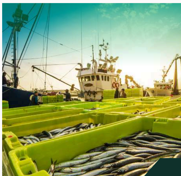
Pesca y Alimentos