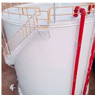
Fabricación de tanque de 900 m 3