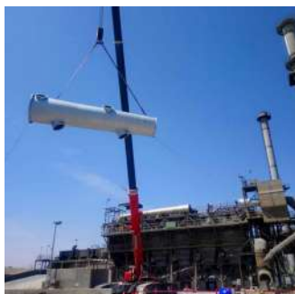
Fabricación y montaje de manifold de entrada y cajón-Bag House Fundición.