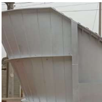
Fabricación cuerpo virola Horno fundición.