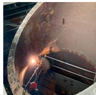
Reparación metalmecánica de la estructura del Horno Asumenlt N1.